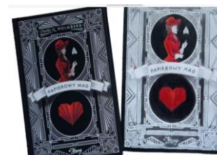
III miejsce Wiktoria Kaczmarzyk